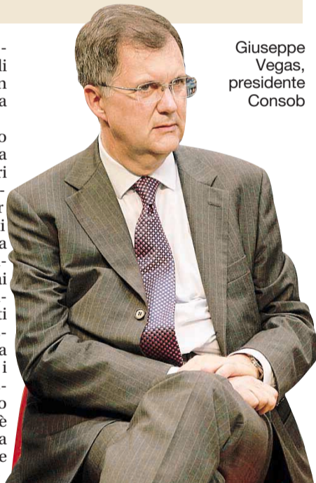
Giuseppe Vegas, presidente Consob

I super-ricchi tornano a investire nel comparto lifestyle e in particolare nei settori dei viaggi e tempo libero, categoria quest'ultima che comprende anche attività come i soggiorni presso spa di fascia alta e le installazioni di attrezzature per il fitness. È uno dei trend segnalati da Expo Luxe, il Salone del Lusso di Roma, secondo il quale oltre la metà delle persone da alto reddito hanno raddoppiato il loro budget per le spese per i viaggi di lusso e per quelli intrapresi per conoscere nuove località e culture.